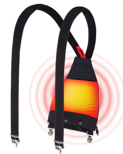
Smarte Lösungen von WORKS

Die „echte Schreinerkleidung“ erhalten Sie exklusiv bei leistungsstarken Handels-