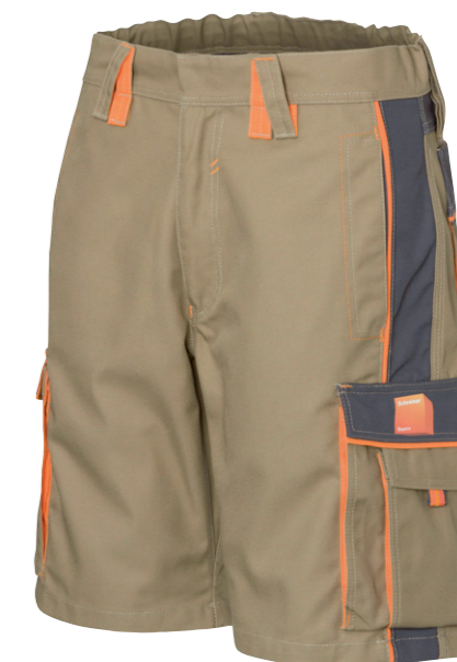
Bermuda aus der TSD-Kollektion